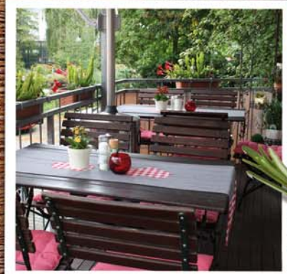
Bei schönem Wetter schmeckt es draußen am Besten!