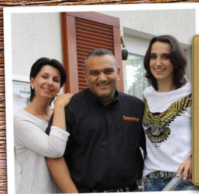
Familie Napolitano freut sich auf Ihren Besuch!