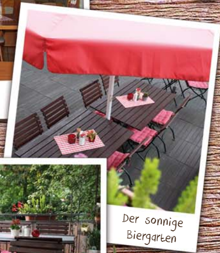
Der sonnige Biergarten