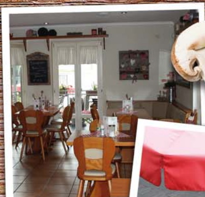
Unser gemütliches, kleines Restaurant