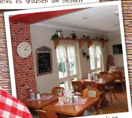
Wir richten Gesellschaften bis 24 Personen für Sie aus!